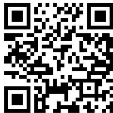
童夢同行採訪報章